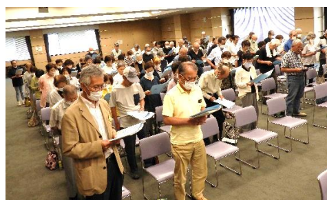
最後は、全員で安全宣言