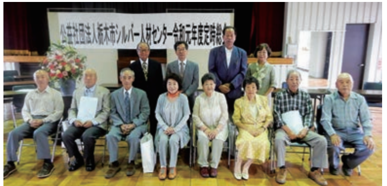
10年・15年・役員表彰された皆様、おめでとうございます