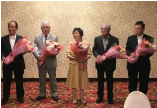
定時総会で退任されました役員の皆様、お疲れ様でした