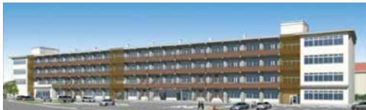
旧栃木中央（第一）小学校跡