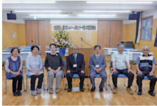
10年・15年表彰された皆様、おめでとうございます。