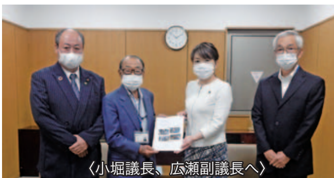
〈小堀議長、広瀬副議長へ〉