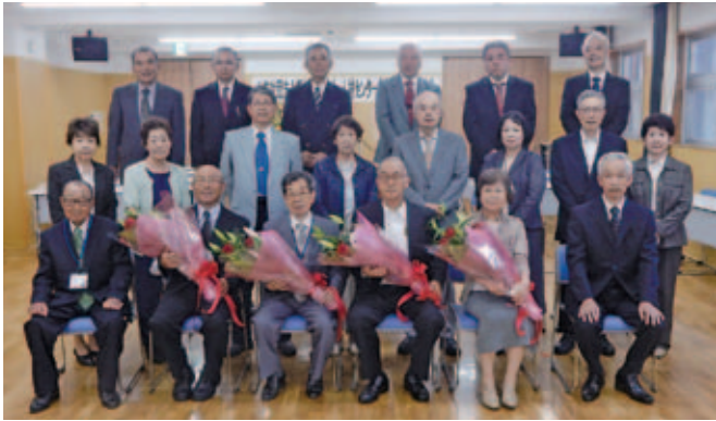
退任された理事の皆様お疲れ様でした。