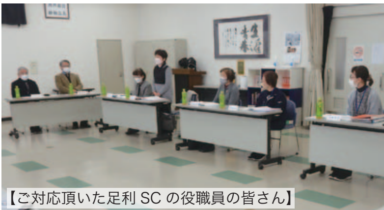
【ご対応頂いた足利 SC の役職員の皆さん】