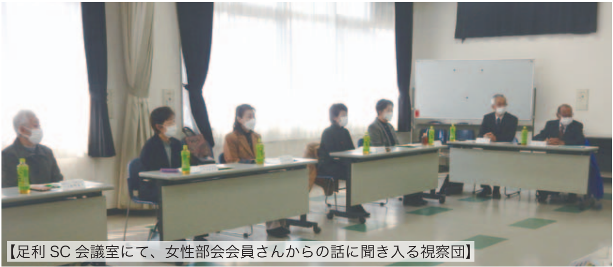
【足利 SC 会議室にて、女性部会会員さんからの話に聞き入る視察団】

～当センター女性会発足に向けて、足利市シルバー人材センター 女性部会「シルモア」について視察研修を行いました。～