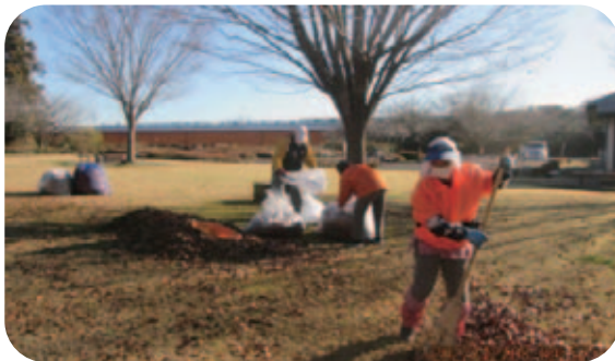
R4.12.8(木) 西方ふれあいパークの 落ち葉清掃 21名参加