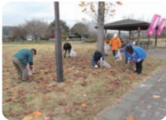
R4.11.29(火) 永野川緑地公園 ウォーク&クリーン作戦 55名参加