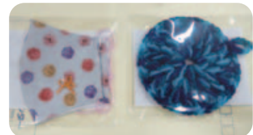
女性部会活動で作成したPRグッズ