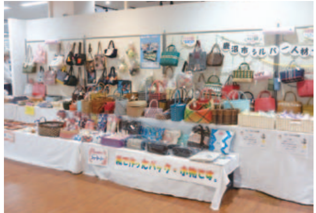
当センター会員の出展ブース(作品)