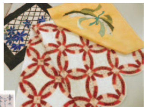
「パッチワーク」 古澤 晶子(都賀)