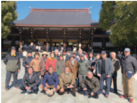
【明治神宮前にて記念撮影】

2月21(火) 東京ちよっ〜びり散策 地域クーポンを利用して築地場外 市場で買い物もできました♪