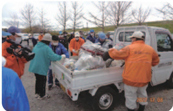
R4.12.3(土) 渡良瀬運動公園美化活動 52名参加 当日は、ケーブルTVの取材を受け、放映されました。