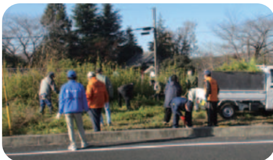
R4.12.10(土) 静和地区公民館 周辺ゴミ拾い 42名参加

※都賀地区については、計画時にコロナ拡大が騒がれた時期もあり、止む無く中止となりました。