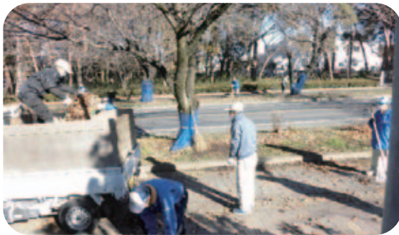
R4.12.8(木) 大平北路線(運動公園・大平中学校前)45名参加