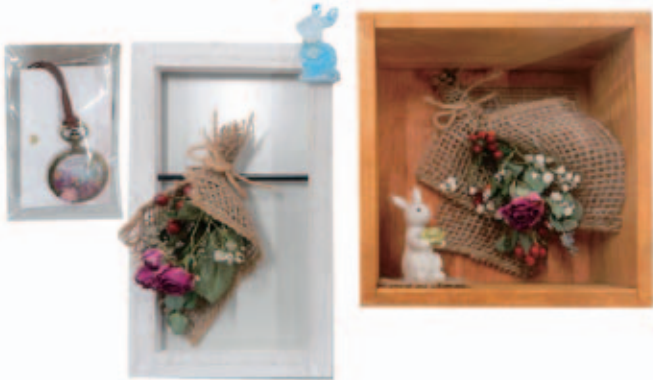
「壁掛けとレジンネックレス」 梅沢 恵子(都賀)