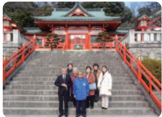
【会員の交流促進と安全祈願に織姫神社へ】

これから、どんな活動をしていくのか、皆さ んと一緒に相談しながら楽しい会を目指しま す。参加してみたいと思われる方はご連絡お待 ちしています。(^^)