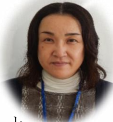
新規採用職員紹介