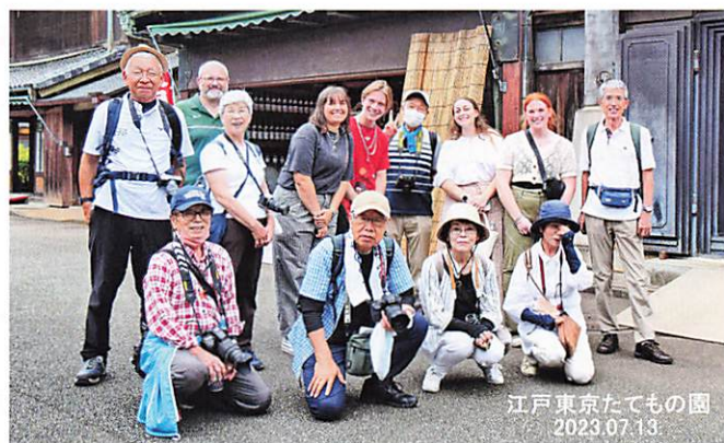
撮影会 観光客とはいチーズ！