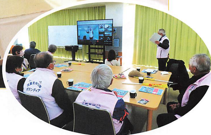
児童見守り活動「感謝の会」