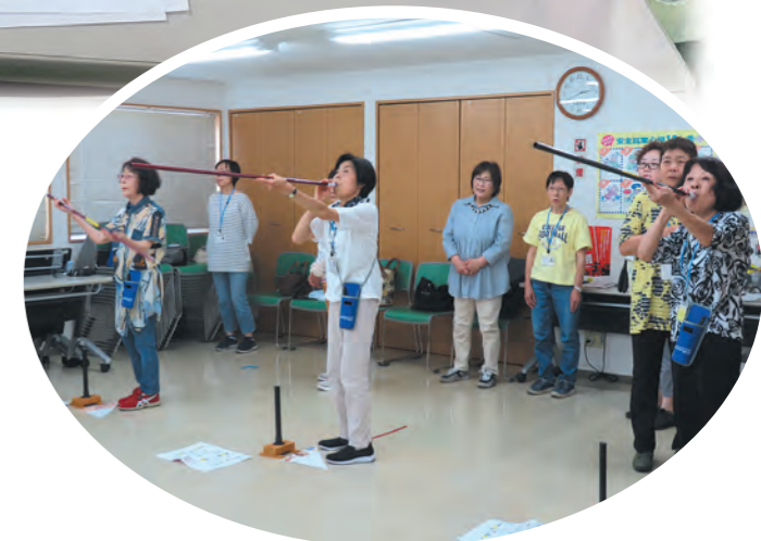
健康吹矢合同体験会 (シルボンヌにいぞ・シルボンヌみささ)