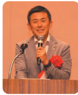
戸田市長菅原文仁様よりご祝辞を頂きました。