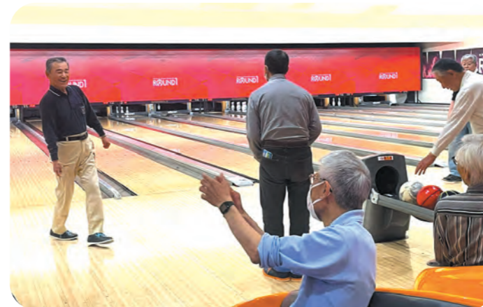
シルバーボウリングサークル