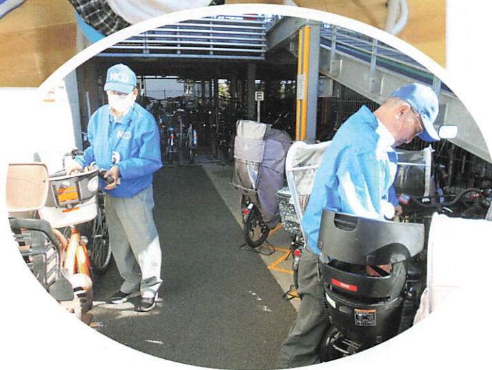
駅駐輪場管理業務