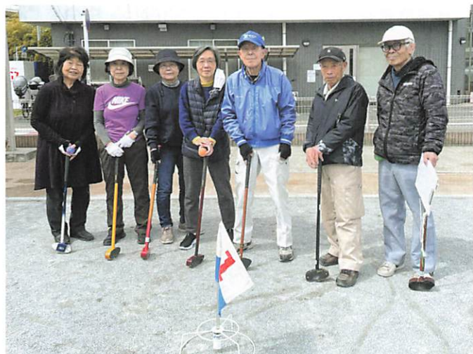
シルバーグラウンド・ゴルフ同好会