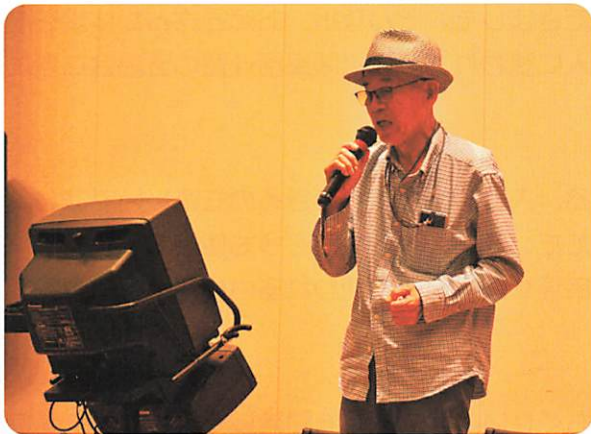
シルバー歌おう会