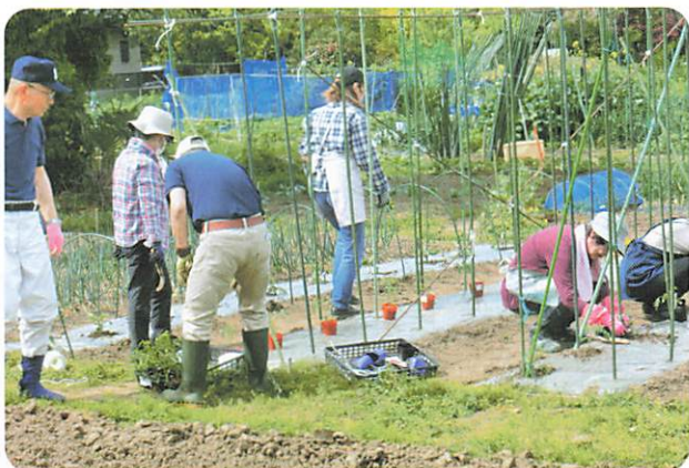
ワイワイ菜園サークル