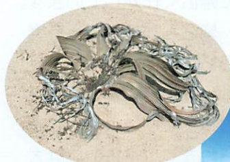
奇想天外 「ウェルウィッチア」

帰路は喜望峰を回ってインド洋側に抜ける道を。こちら側の入江には、喜望峰と間違えて迷いこむ船が多く、今まで300隻以上が遭難したそうです。(次号へつづく)