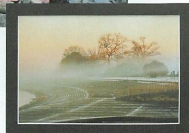
市展受賞作品「染まる朝霧(彩湖にて)」