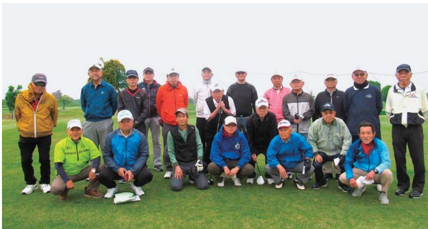
川口市シルバー人材センターとの合同コンペ

「プレー中は、ゴルフ談義から近況報告まで話が尽きません。プレー後は表彰式を行ない“ニアピン賞”や“何でもニアピン賞”など『渡しの会』独自のルールもあり、たくさんの賞と商品が用意されていて、表彰式はとても盛り上がりますよ。新しい仲間を募集中ですので気軽に声をかけてください」