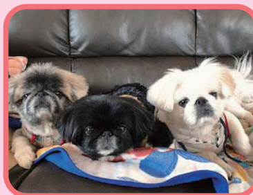
左: なな 中: 小太郎 右: 桜空(さくら)