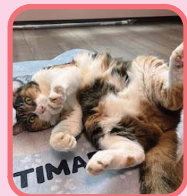
保護猫 ミーちゃん