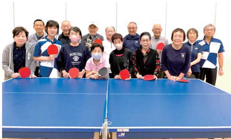
シルバー卓球クラブ