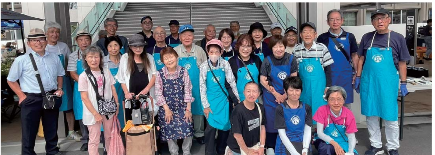
戸田朝市に協力して下さる会員の皆様（広野委員長：前列右から3人目）

コミュニティに貢献できて、会員同士の新たな交流も生まれるイベント活動を、私たちと一緒に楽しみませんか？ あなたの力を貸してください！お待ちしております！