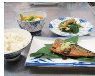
減塩満足おかず 完成品