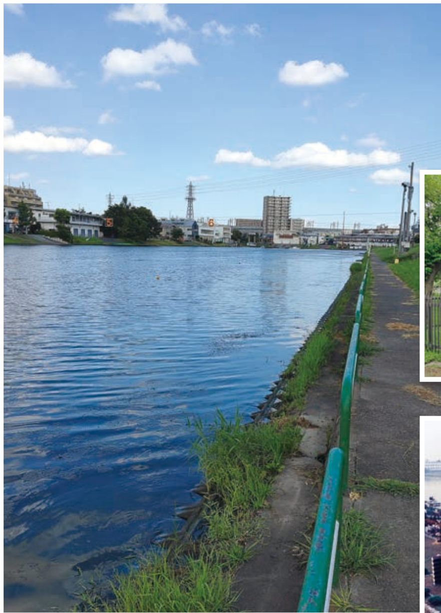
▲戸田ボートコース