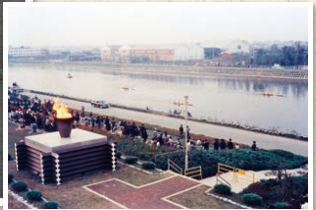
▲ 1964年東京オリンピック時のボートコース