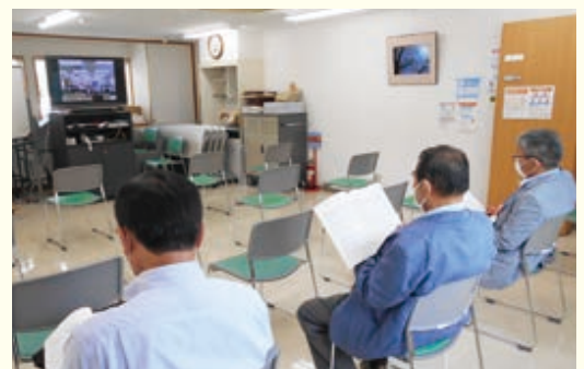
ソーシャルディスタンスのためのオンライン中継