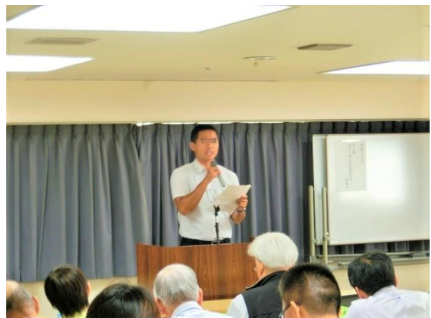
グループ討議後の発表