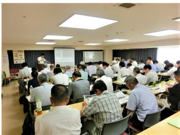
安全・適正就業推進員等研修