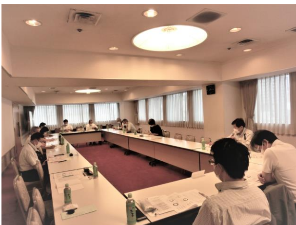
安全衛生・適正就業推進委員会

また、健康管理も安全対策において重要な要因となることから、令和4年4月1日に安全委員会の下に衛生委員会を設置し、シルバー会員やセンター職員の健康管理についても、調査・審議しているところです。