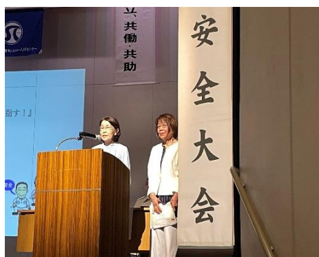
(安全就業事例発表)