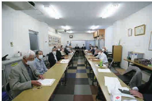
参加者を限定した総会となりました

本総会は、昨年、一昨年に引き続き新型コロナウイルスの感染拡大防止のため、新旧役員のみ出席で、多くの会員の皆様から書面決議をいただきました。