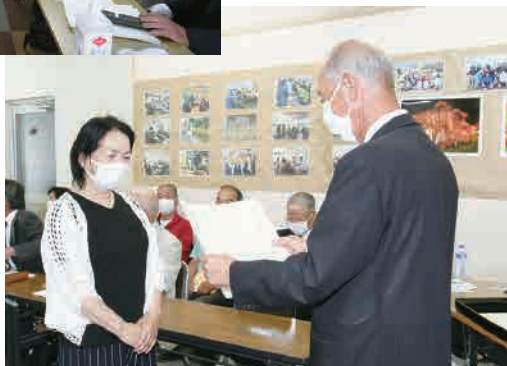
功労表彰が行われました