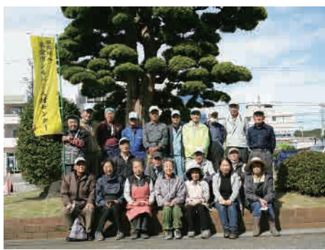
上 作業終了後市役所前で 下 除草作業中