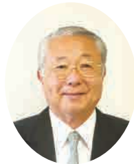
東金市長 鹿間 陸郎