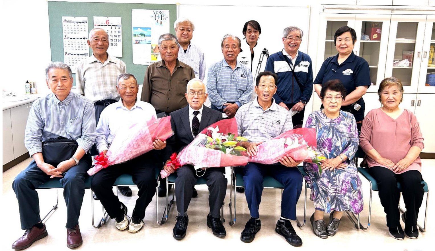
(写真) 令和5年6月15日定時総会及び臨時理事会終了後の退任式