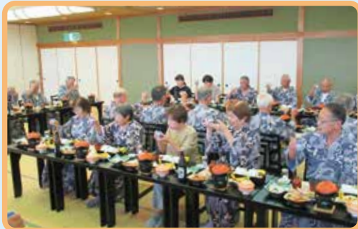
あわら温泉 (福井県)