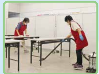
市民活動施設の清掃