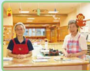
子育て支援施設の受付