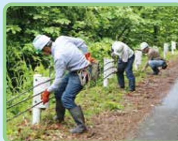
林道のガードロープ取り付け