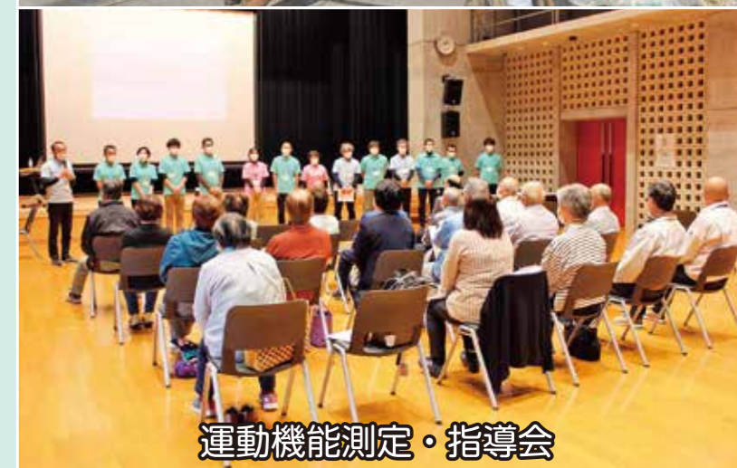
運動機能測定・指導会