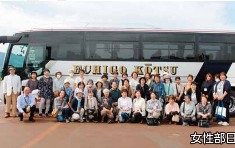
女性部日帰り旅行