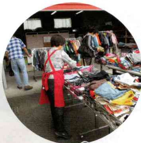
リユースショップ 店員