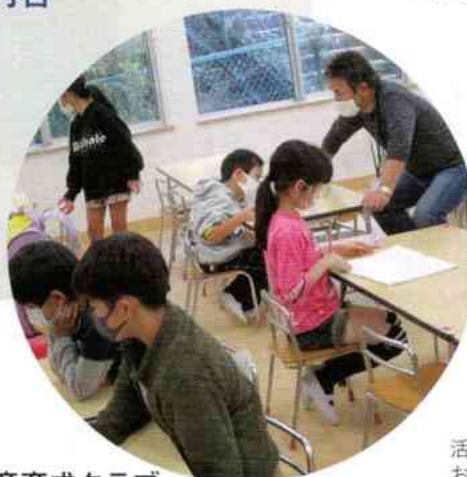
児童育成クラブ スタッフ