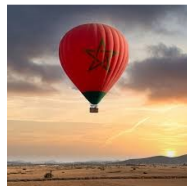
マラケッシュの朝

免税事業者である会員の配分金は、今後、消費税の仕入れ控除の対象外となりますが、令和8年9月末までは、経過措置として仕入税額相当額の8割が控除可能です。(配分金に含まれる消費税分内の8割を仕入控除税額とみなす)