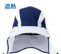
ヘッドガード帽 (右は遮熱帽)