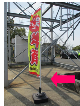
転倒したのぼり旗

とこなめ市民交流センターや当センターには、小さなお子さん連れの方も来場されます。他者に加害を加えることが無いよう、強風等が予想されるときは無理に設置せず、安全第一で営業をお願いします。