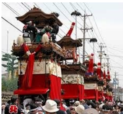
常滑に春を告げる山車まつり