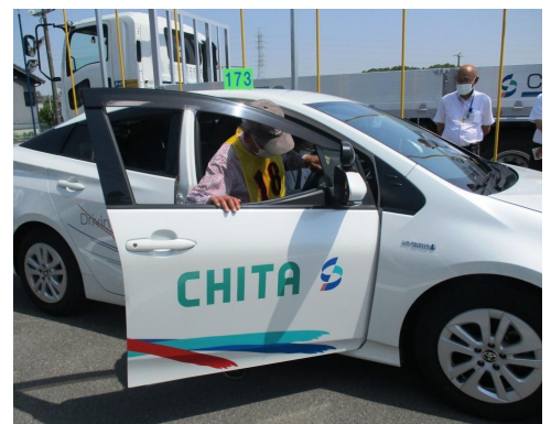
知多自動車学校での講習の様子