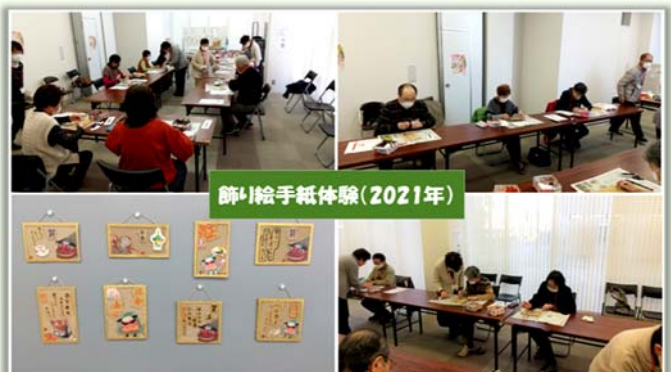
(悠和会イベント写真)