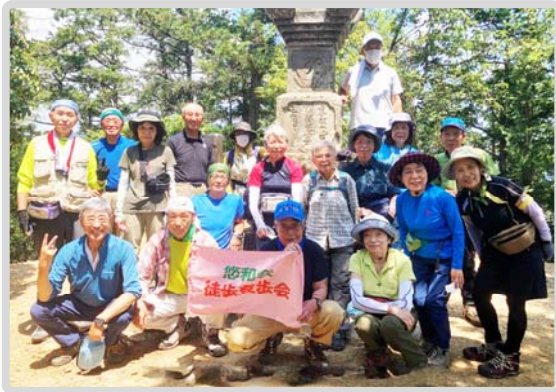
※活動日=毎月1回以上/定例会 第1水曜日 ※場 所=郊外 ※年会費=1,200円

ます。冒頭のNさんの夢はアルプス走破と明言されました。その夢を叶えられる会で有りたいたいと思います。