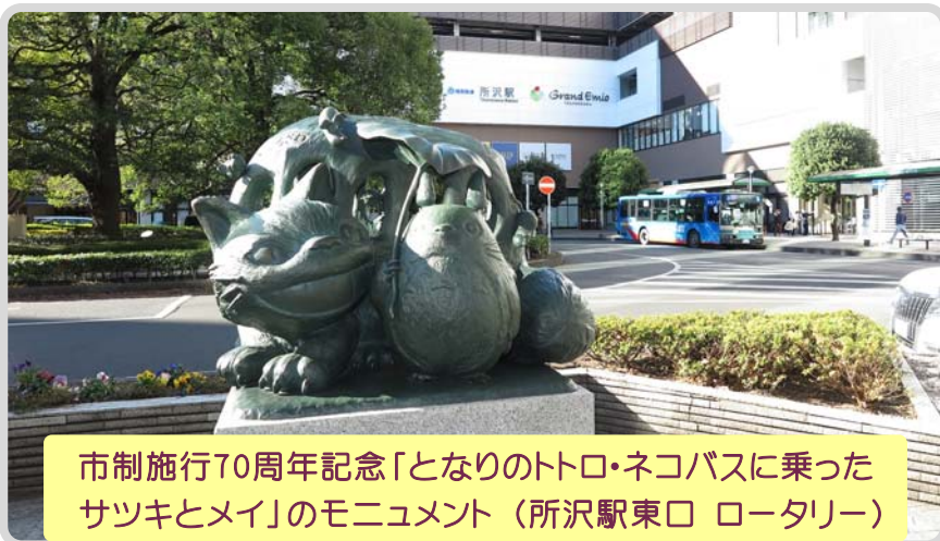
市制施行70周年記念「となりのトロ・ネコバスに乗ったサツキとメイ」のモニュメント (所沢駅東口 ロータリー)

当地区の班長は、全地区の中でも平均年齢が70歳代後半と高い方ですが、元気で頑張っておられる事が地区のアピールポイントです。 今年度も共働共助とチームワークで地区運営に努めますのでどうぞ宜しくお願い致します。 (参考文献・「とらぎわ歴史物語」より)