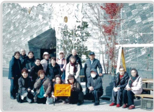
※活動日=月1回 ※場所=不定 ※年会費=1,000円・実費

◎西サークルともコロナ禍での活動状況については悠和会事務局に確認してください。 ☎04・2928・8695