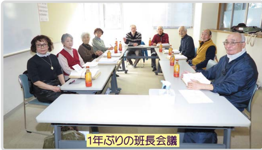
1年ぶりの班長会議

店舗が並び、町の顔になりました。明治28年に川越鉄道が開通すると駅周辺にも賑わいが広がりを見せました。 明治時代には織物の町として発展し、大正時代には飛行場の町として全国から注目を集めるようになり、人口も急増します。