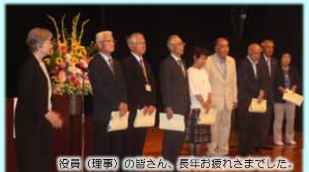
役員（理事）の皆さん、長年お疲れさまでした。