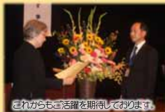
これからもご活躍を期待しております。