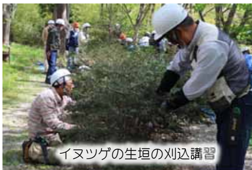
いヌツゲの生垣の刈込講習

終了後は早く帰って、「ここで学んだ知識と技で自宅の庭木を手入れしたいと皆さん意気揚々の印象でした。(取材・佐久間)