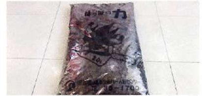
腐葉土(はっばの力)