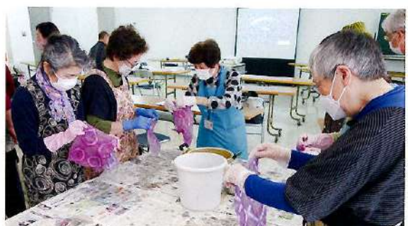
ハスカップ染め講習