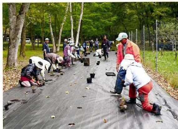
ハスカップ苗木植樹