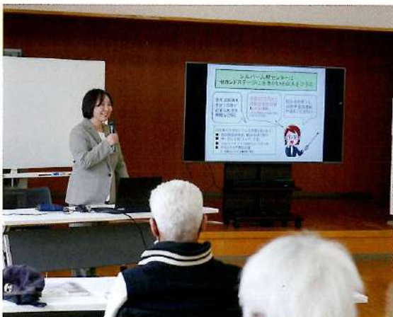
名刺がない! シニアライフの生きがい探し