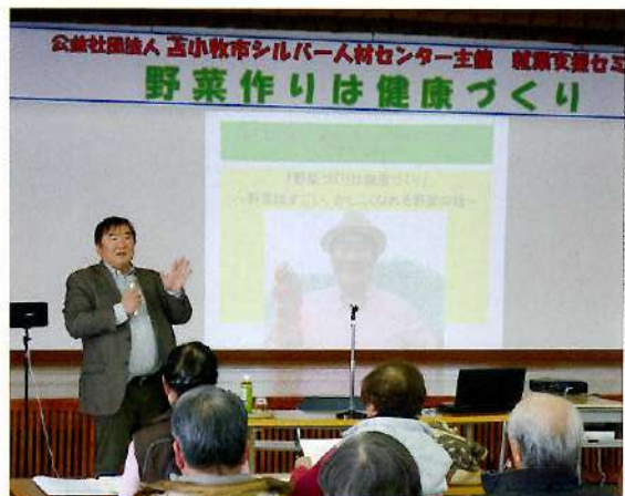
野菜作りは健康づくり