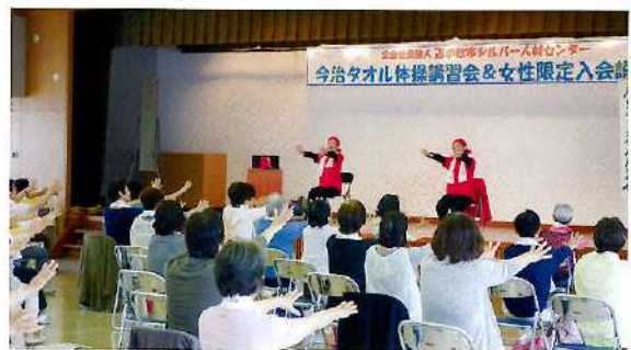
今治タオル体操講習