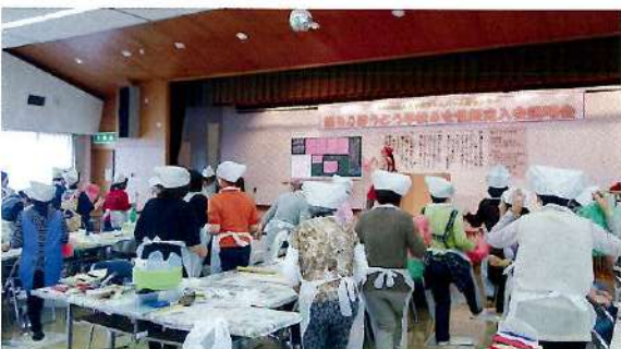
踊るほうとう学校