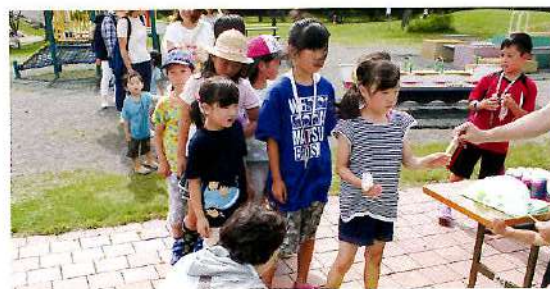
金魚・ヨーヨーすくい