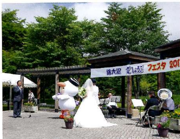
花しょうぶフェスタ