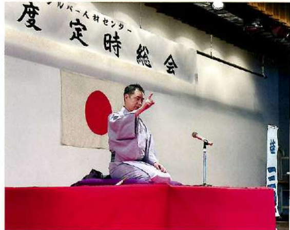
総会前には健康教室も開催