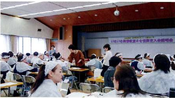
いきいき美容教室