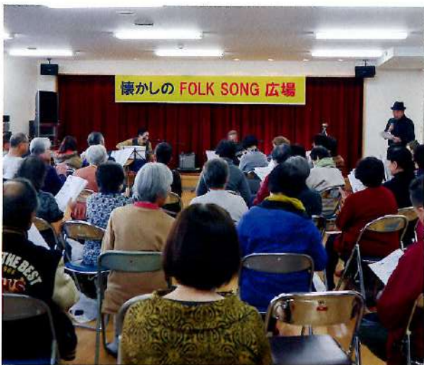
懐かしのフォークソング広場