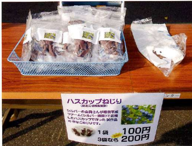
収穫したハスカップを使用したお菓子