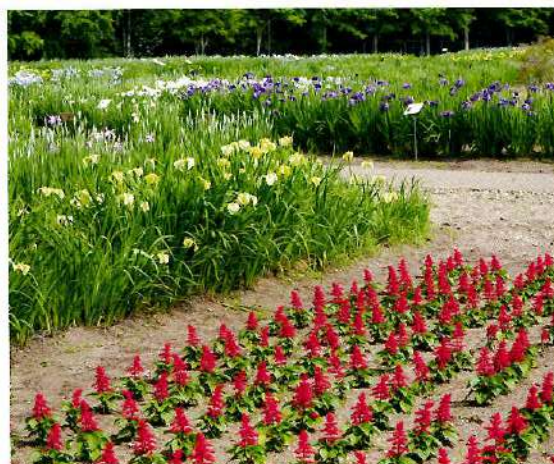
広大な花しょうぶ園