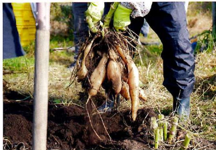
収穫したヤーコン