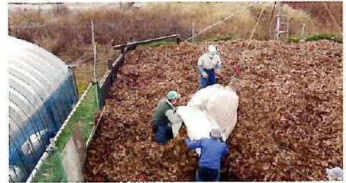
腐葉土作りの様子