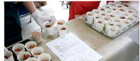
収穫したヤーコンはドーナツなどにして提供