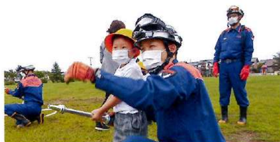
防災講習～園児のところに火の用心～