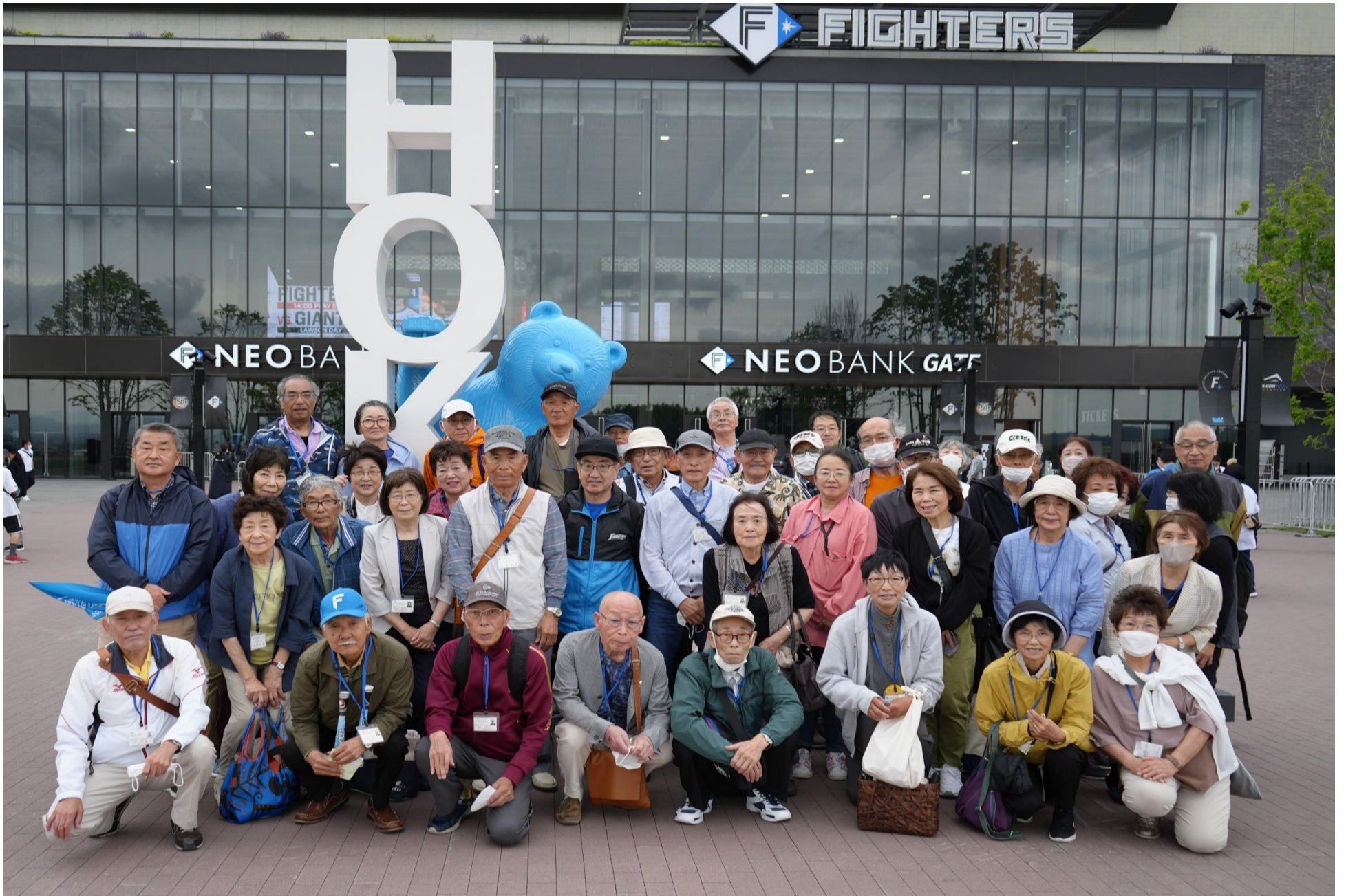
エスコンフィールド前にて 記念撮影

日時 令和6年6月16日（日） 場所 北広島市：エスコンフィールド 交通 貸切バス（HANAバス） 内容 日本ハム対巨人の交流戦観戦