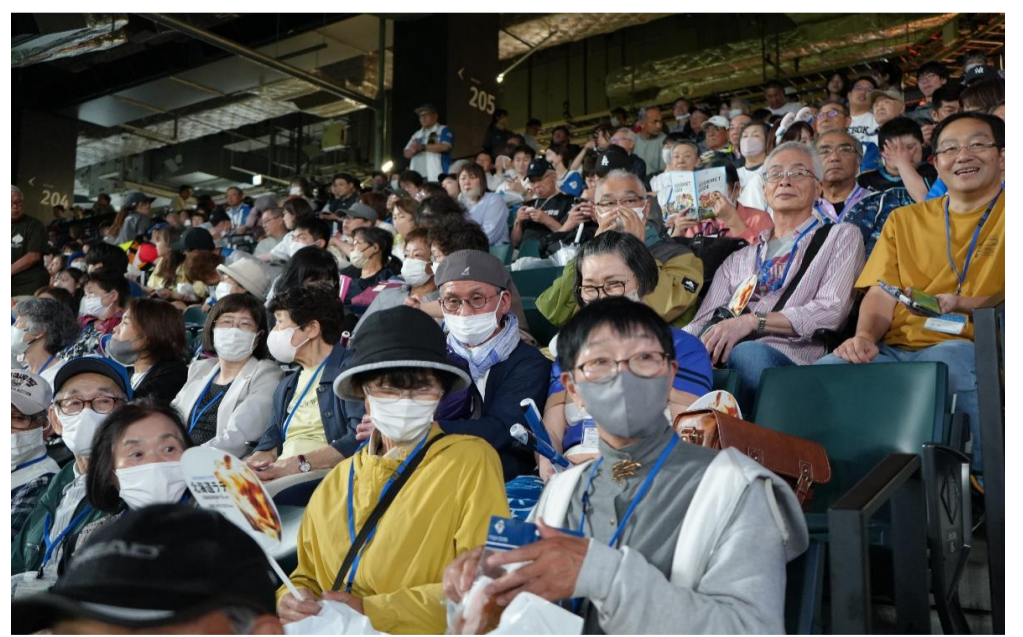
スタンドにて試合観戦