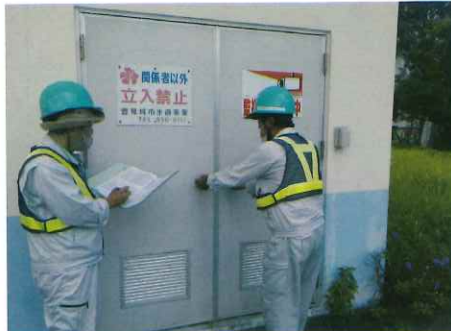
【配水施設巡回清掃】 配水施設の施錠点検、異常の確認、清掃作業を行っています。