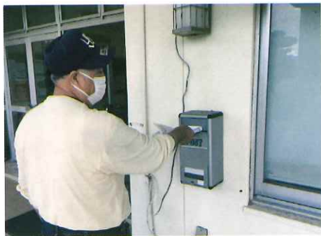
【「広報とみぐすく」配布委託業務】 豊見城市の発行する「広報とみぐすく」及び折込チラシを市内全世帯へ配布しています。