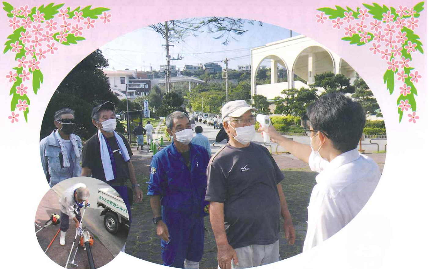
コロナ対策として作業器具の消毒