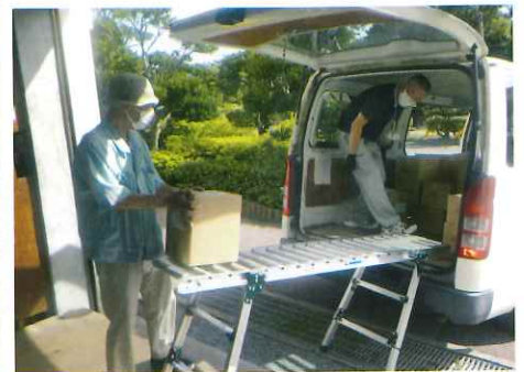
【市指定ごみ袋販売委託業務】 販売店に対して市指定ごみ袋の販売、配達を行っています。