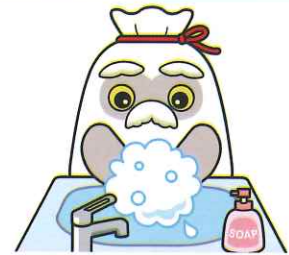
手洗い・消毒の徹底