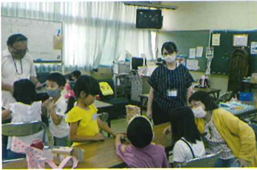
【放課後子ども教室】 市内全小学校にて子ども達の安全・安心な居場所をつくり、学習支援等を行っています。

豊見城市から受託している仕事の一部をご紹介します。その他にも一般家庭や企業等から幅広く仕事を承りますので、ご依頼の際はセンターへご連絡下さい