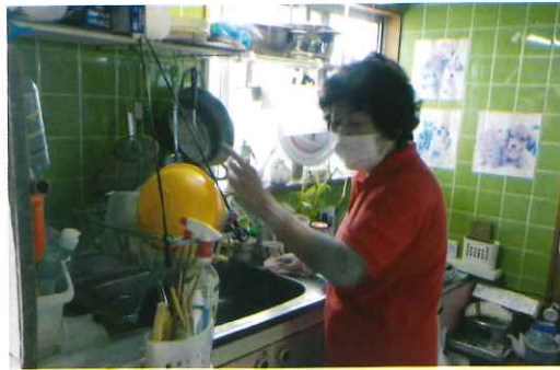
【訪問家事援助事業(新総合事業)】 高齢者が在宅で自立した生活を送れるよう、清掃、調理、買い出しの援助を行っています。