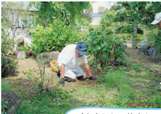
ご家庭からの仕事も、お客さまから感謝の声をいただいています