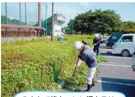
みんなで協力、いい汗キラリ