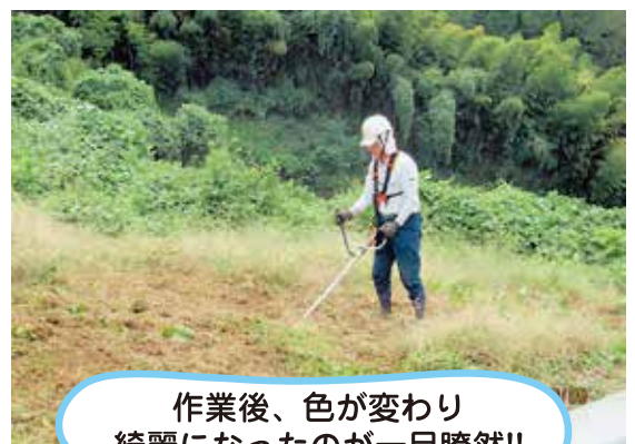
作業後、色が変わり 綺麗になったのが一目瞭然!!