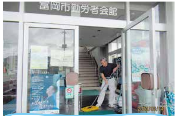
利用者に喜ばれるようキレイにしています