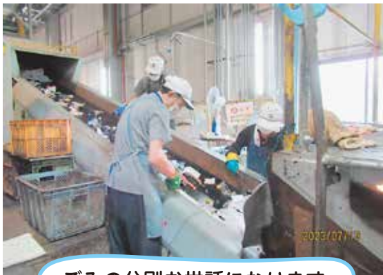
ごみの分別お世話になります