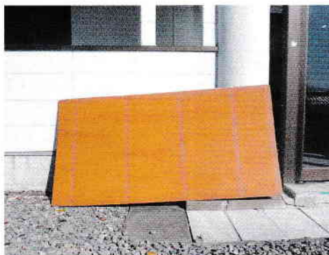
左の写真の「防護ネット」は折りたたみ式で、下に車輪が付いています。