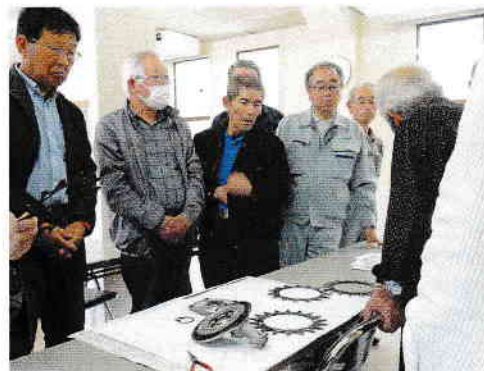
連合会による「カルマー講習」（富岡会場）と「カルマー」

センターでは、上に記載の草刈り機「カルマー」のほかにも、石飛事故防止策として、写真の「アルミ製防護ネット」や「ベニヤ板」を用意していますので、面倒くさがらずぜひ活用してください。ひとたび事故が起きると、その賠償や謝罪、事務処理など長期間にわたり大変な労力を必要とする場合も少なくありません。何より弁償できる物ならまだいいのですが、人に当たってしまったでは取り返しが