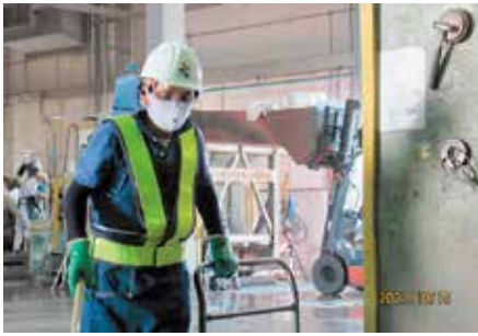
資源化センター・資源物分別