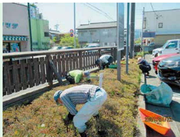
宮本町駐車場・草むしり