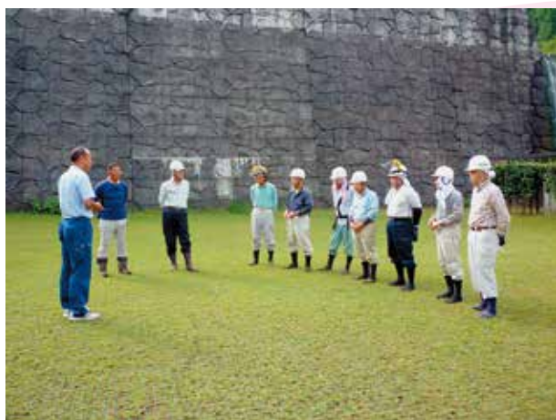
立沢ダム・作業前朝礼