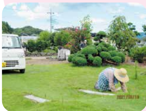
個人宅・草むしり