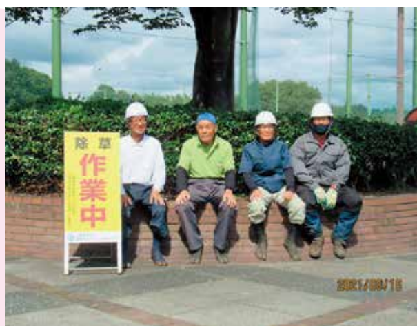
もみじ平・つる取り