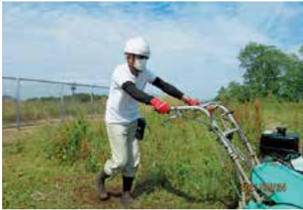
観音山遺跡・自走式草刈