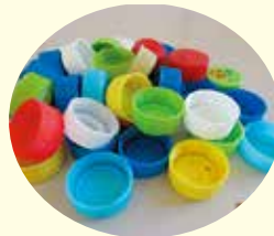
ペットボトルキャップ