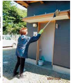
桐淵公園・トイレ清掃