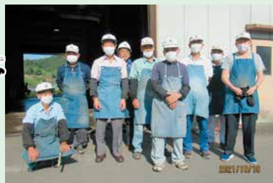
資源化センター・資源物分別