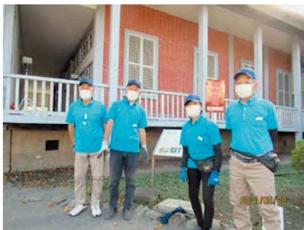
富岡製糸場・清掃、除草