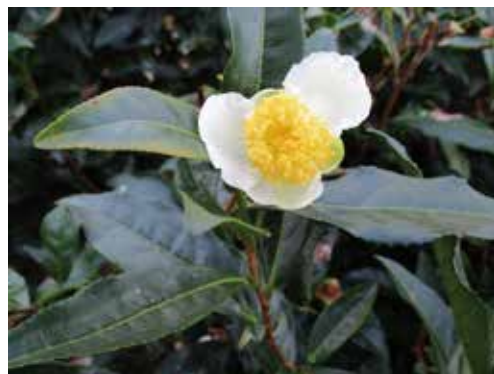
可憐なお茶の花 花言葉は「追憶」