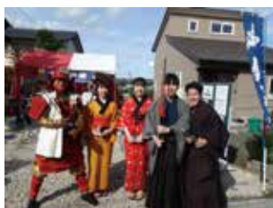
平成30年10月富谷宿街道 まつりで富谷茶初振る舞い