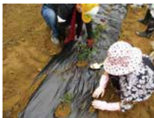
「大きくなあれ」と苗木定植