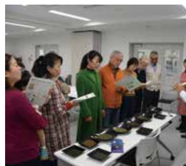
令和元年11月おいしいお茶の入