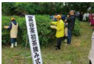
平成30年5月 富谷茶初茶摘み式