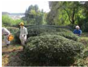
おいしいお茶のために 日々の管理が大事です