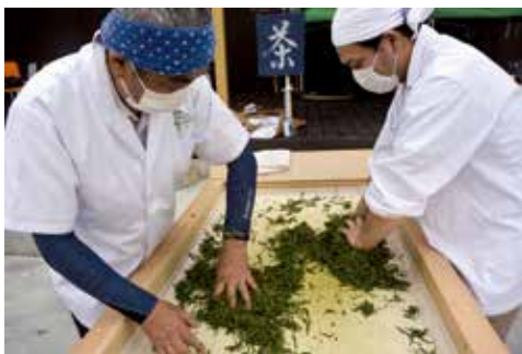
初の試み「焙炉」による製茶