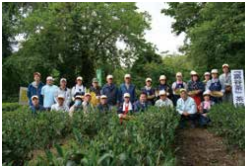
4回目となる茶摘み式