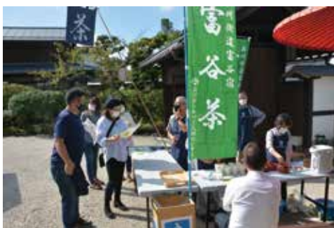
令和3年10月とみやどオープニング セレモニーでの富谷茶振る舞い