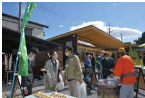
令和2年10月富谷茶と宿場町を楽しむ会で 富谷茶事業紹介