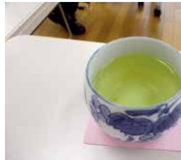
ほのかに甘くおいしい富谷茶