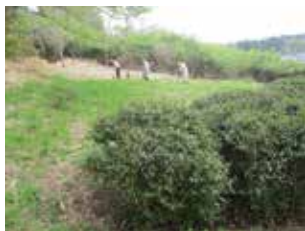
苗木を植える土地を開墾整地