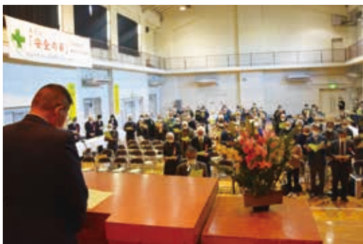
安全就業宣言唱和