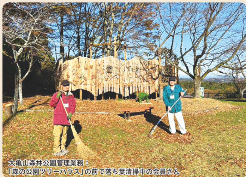
大亀山森林公園管理業務： 「森の公園ツリーハウス」の前で落ち葉清掃中の会員さん

10月6日より「とみやど」にて「しんまちキッチン by ズーバー FOOD」が開店！会員さんが笑顔で愛情のこもった手作りのおにぎりと豚汁を提供、心温まるお料理とみんなが気軽に寄れる温かい空間をつかって接客し活躍しています！