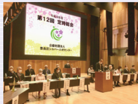
昨年の総会の様子

今年度の総会につきましては、新型コロナウイルス感染症が収束していませんが、感染法上の位置づけを季節性インフルエンザなど同じ「5類」に移行されたことから、4年ぶりに来賓をお招きして式典を実施し開催いたします。しかしながら、会員の皆さまにおかれましては、感染リスクを回避し、健康を保持するため、総会当日に出席しなくても議決権の行使を行っていただけるよう、代理人への「委任状」または「議決権行使書」での意思表示ができる方法も昨年度同様に採用しています。すでに多くの方に出欠連絡用紙にて「委任状」や「議決権行使書」を提出していただいております。誠にありがとうございます。まだ未提出の方におかれましては、 6月14日(水) までに出欠連絡用紙を提出していただきますようお願いいたします。粗品につきましては、昨年度同様に総会会場でのお渡しはいたしません。下記のとおり、後日センター等でお渡しいたします。