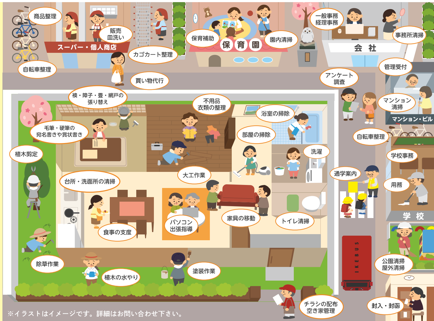
※イラストはイメージです。詳細はお問い合わせ下さい。

センターの会報誌が到着し、安全情報や研修会・講習会、イベントなどの案内を受け取ることができます。もちろん、参加もできます。