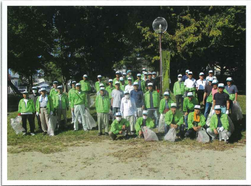
◆ ボランティア清掃活動（4月・10月） 写真は10月の参加者の皆さん