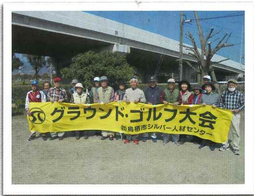
◆ グラウンド・ゴルフ大会（3月）