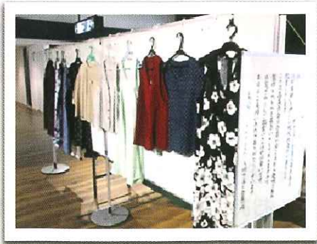
◆ 会員の作品展示会（9月・10月）15名の方から64点出品