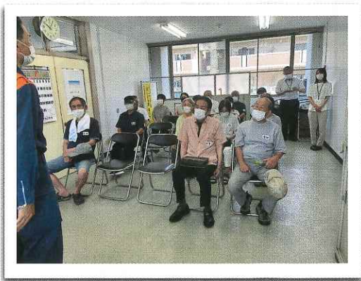
◆ 救急救命講習会（7月）