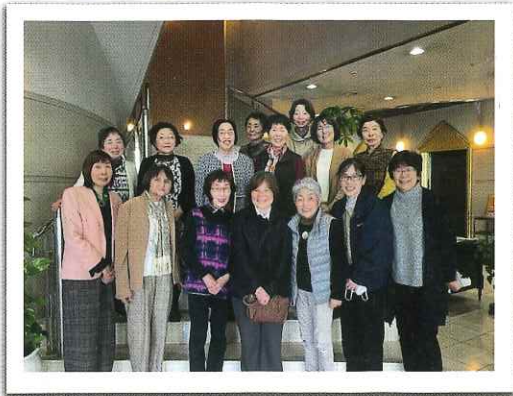
◆ なでしこの会視察研修（2月）