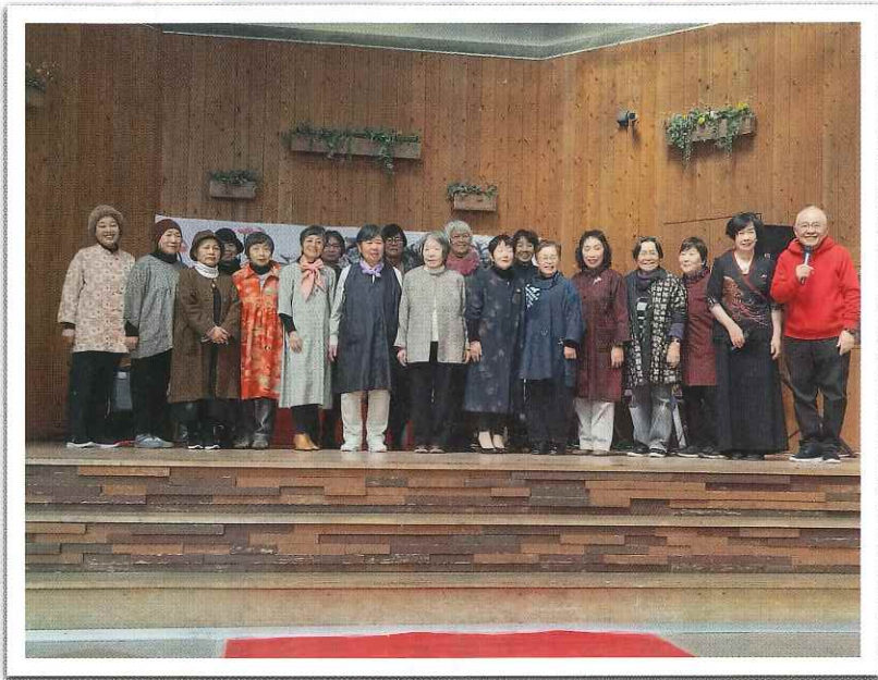
◆ 佐賀市で開催されたシルバーフェア（3月） 写真はファッションショーに出演した皆さん