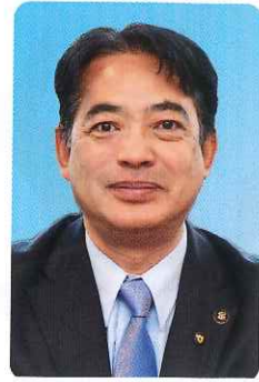
鳥栖市長 向門慶人