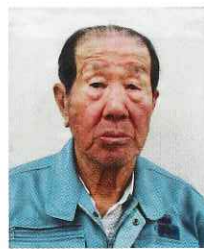
除草班 執行 裕一 H23 入会

①入会の動機 ②現在の仕事内容 ③作業に対する心がけ（やりがい等） ④健康法 ⑤趣味は ⑥会員となつて