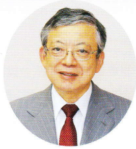
豊橋市長 佐原 光一

AI・ロボット・IoTなど技術革新が大 きく進み、日本の経済、私たちを取り巻く 生活、仕事にも多分にかかわってゆく、そ うしたなかとはいえ、まだまだ高齢者のもつ