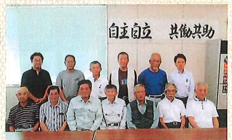
安全・適正就業委員会