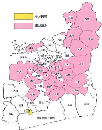
かわら版掲載状況