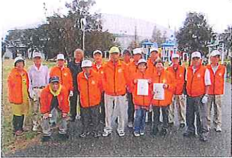
豊橋総合スポーツ公園