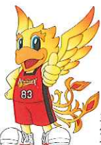
三遠ネオフェニックス 公式マスコット ダンカー