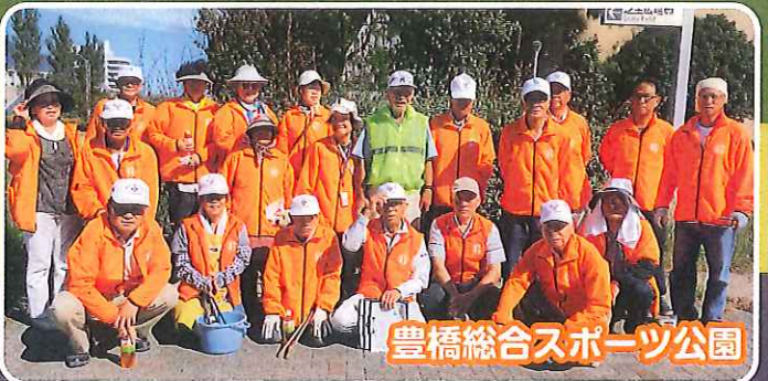
豊橋総合スポーツ公園