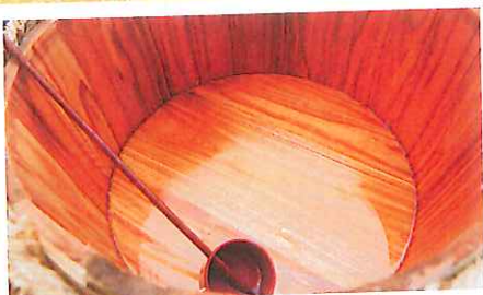
空樽(カラッポ、お見事)

鏡開きに使用された銘酒「四海王」も余すことなく飲み干され、華やかで活気あふれる様子は、この先の10年におけるセンターの力強い歩みを予感させるものでもありました。