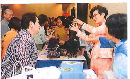
ソーイング班も出店(いらっしゃいませ)