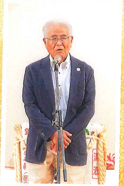
会長挨拶(おめでとうございます)