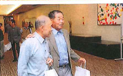
参加会員(50周年も今から楽しみ!!)