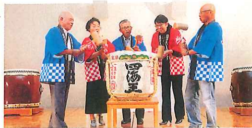
鏡開き(せ〜の、ヨイショ)