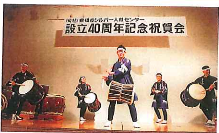
和太鼓集団「志多ら」(大迫力)