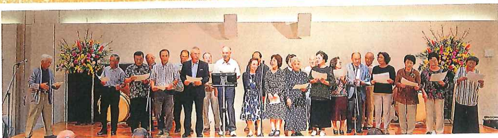
カラオケ同好会(しあわせは歩いてこない♪)