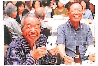
ビンゴ大会(笑顔・笑顔・笑顔)