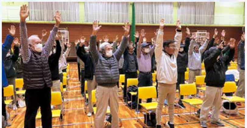
ちょこっと体操の様子

令和6年2月22日午前中に市総合体育館で、会員が健康で安全に就業するための情報を共有するために「安全・安心のつどい」を開催しました。このつどいには204名が参加し、第1部ではハマダスポーツ企画の講師による日常生活でできるちょこっと体操として、椅子に座ってできる健康講座がありました。ひきつづき、第2部では豊橋警察署による「交通安全講話」もありました。最後に参加者全員で「事故ゼロ」を唱和し終了しました。