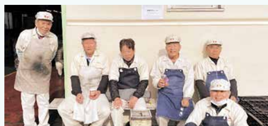
ある日の検査業務担当の会員の皆さん