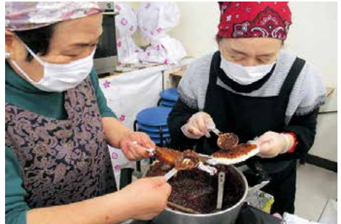
2.16 自家製くるみ味噌だれを五平餅へ塗る作業中