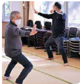
二十四式太極拳のひとつ形