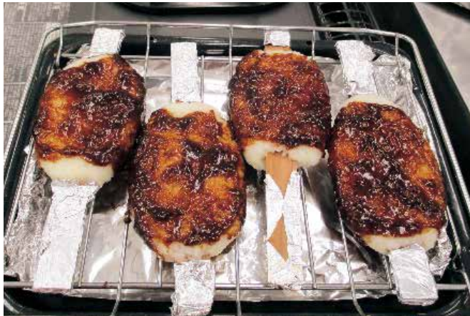
1.16 出来上がった味噌だれ五平餅

令和6年からは地域の生涯学習センター（旧 地区市民館）などを活用した、五平餅づくり講習会の開催について委員会で話し合う予定です。