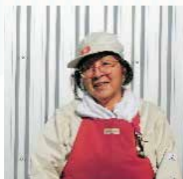
清掃担当の会員さん