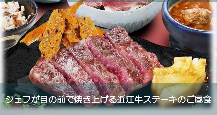
シェフが目の前で焼き上げる近江牛ステーキのご昼食

関ヶ原古戦場記念館と「エアークアール」の工場見学とお買物 ～ふんわりタオルのお土産付き～ 関ヶ原日帰りの旅