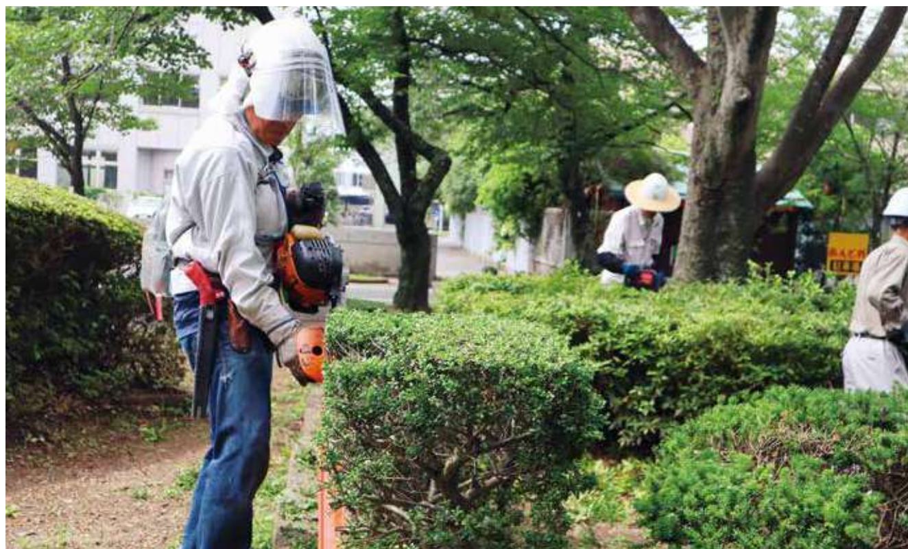
▲ 豊川公園剪定の様子(総勢31名)