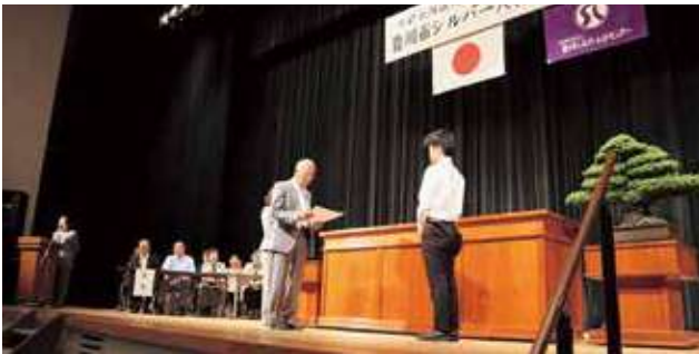
▲一般表彰の株式会社タカラ・エムシー様