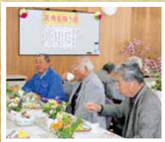
女性委員会がお花とお茶でおもてなし♪

健康のこと、 家族のこと、 お仕事のこと… 話題は尽きません。 皆さんで 楽しい時間を 過ごされました。