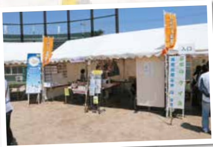
▲ブースは、このように設置しました。

当センターでも、ブースでハンドメイド作品の販売と似顔絵コーナーを開 催したり、市民”おどら舞”コンテストに出場したり、市から委託された会 場内の清掃のお仕事をしたりと、会員は大活躍でした。