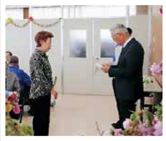
会長から祝い金を授与。

2019年度 4月19日(金)にセンター会議室において盛大に開催されました。対象者26名中14名が参加され、会長から祝い金が授与されました。