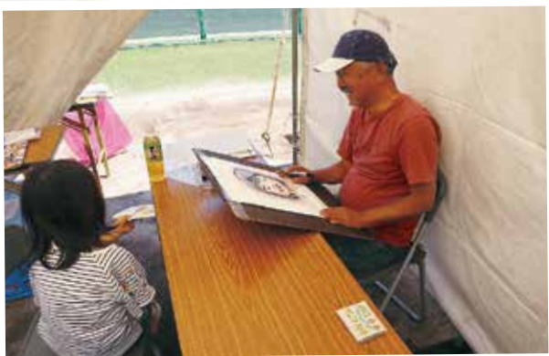
▲今年も大人気！清水画伯による似顔絵コーナー。

会員が作成したハンドメイド 作品の売れ行きも好調でした。 特に84歳の会員が作る紙傘は 今年も一番人気で、2日間で60 個売れました。 祖父母や両親のプレゼントに するのか、子供たちもたくさん 買ってくれました。