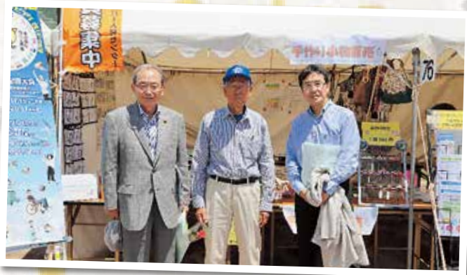
▲山脇実市長と田中義章副市長が遊びに来てくださいました。