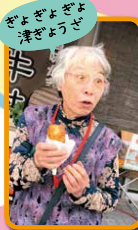
ぎよぎよぎよ 津ぎょうざ