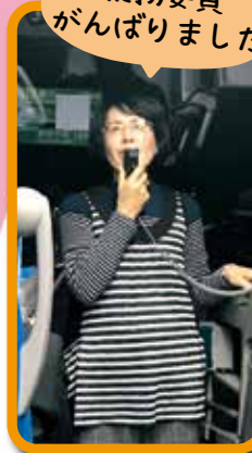
総務委員 がんばりました