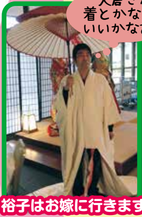
大倉さん 着となくて いいかなあ...