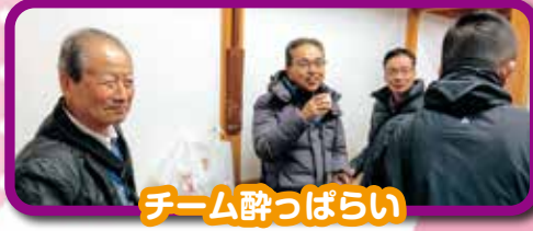
チーム酔っぱらい