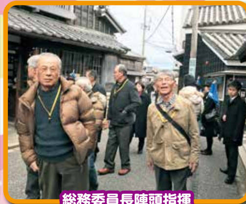
総務委員長陣頭指揮