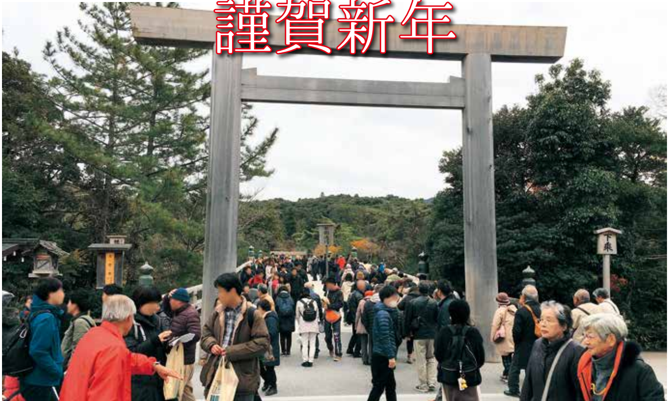
▲ 親睦旅行の様子(参加者95名)