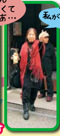
私が入ってないけど