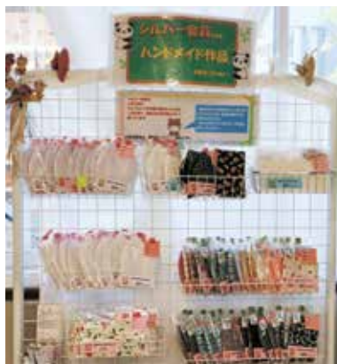
市役所売店で販売

コロナウイルスが猛威を振るい、マスクの入手が困難になってきた頃、ある会員が女性職員のために可愛いらしいプリント柄のマスクを作ってきてくれました。天然素材で作られたマスクはとても肌触りがよく「販売してみたらどうか」ということになりました。当センターでは、市役所内で売店を運営しており、会員のハンドメイド作品も販売しています。2月の中旬頃に試しに何枚かおいてみたところ、最初は数枚しか売れなかったのですが、購入者がS