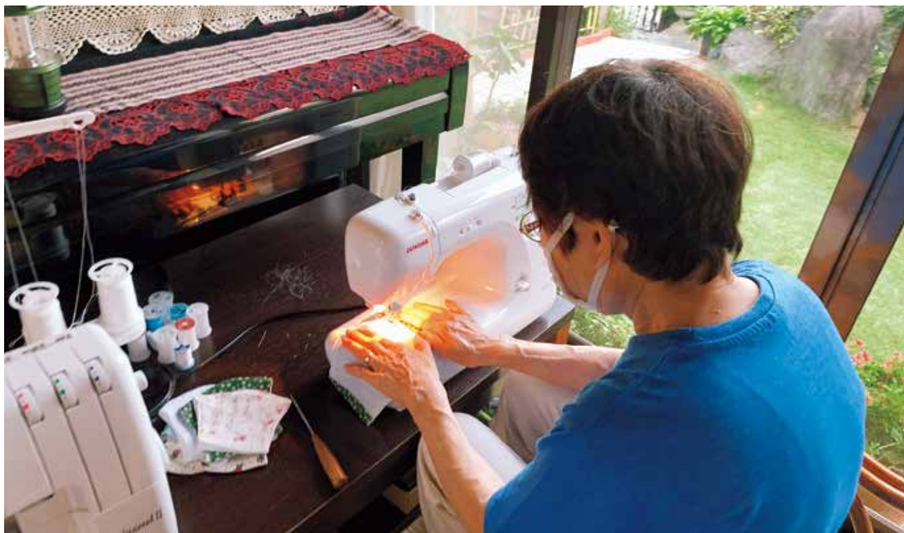
おうち時間を有効活用『マスク製作』