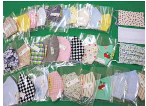
平均300円程で販売。親子マスクもあります。